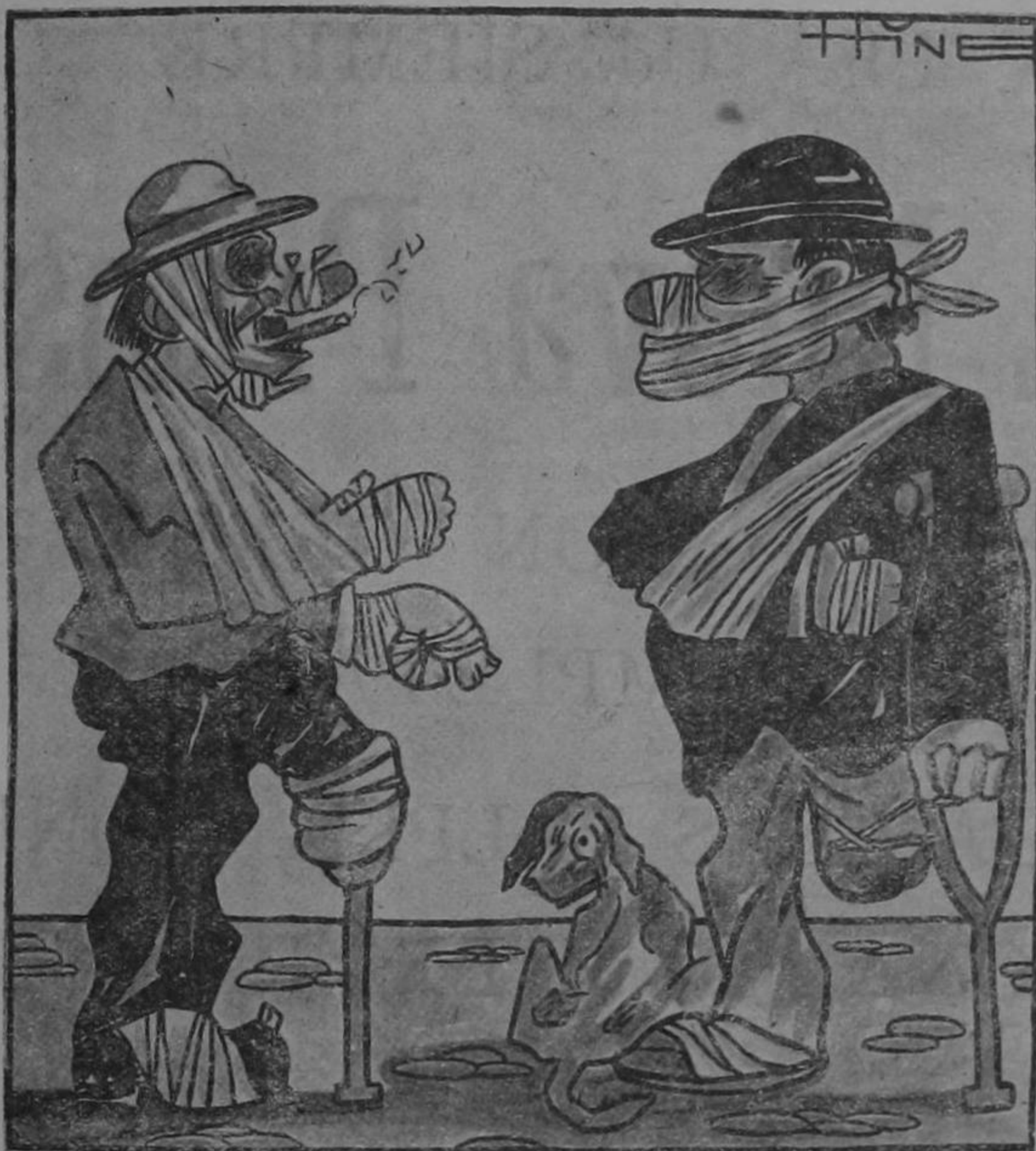
Dibujo de Hine