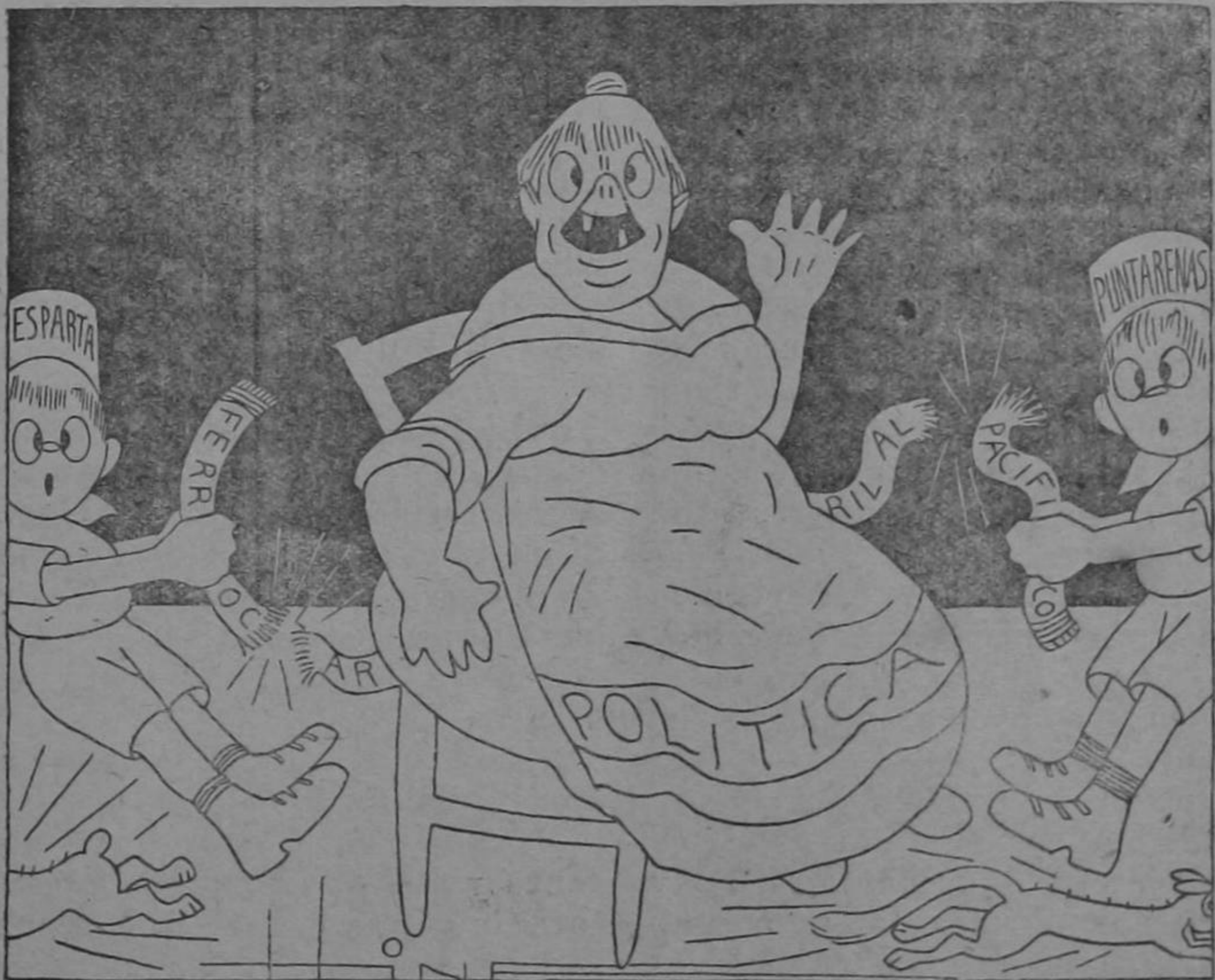
Dibujo de HINE