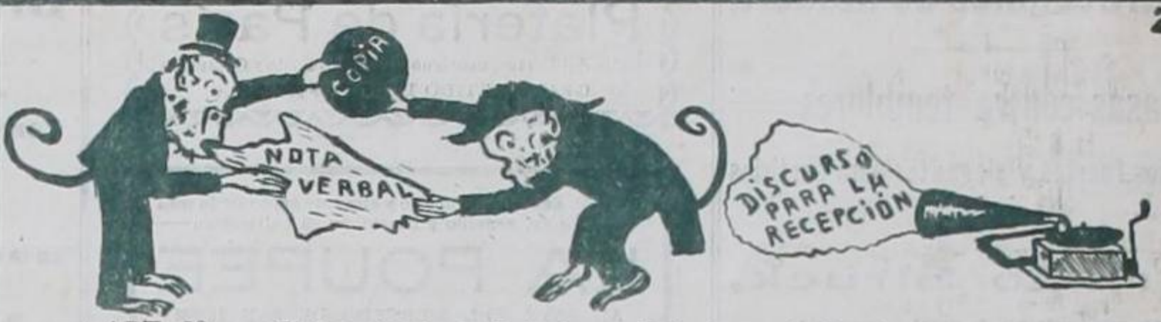
ART. 2º—... El Secretario de Relaciones Exteriores, la hará saber por medio de nota verbal al Ministro Diplomático y éste entonces le remitirá copia del discurso que piense pronunciar en su recepción.