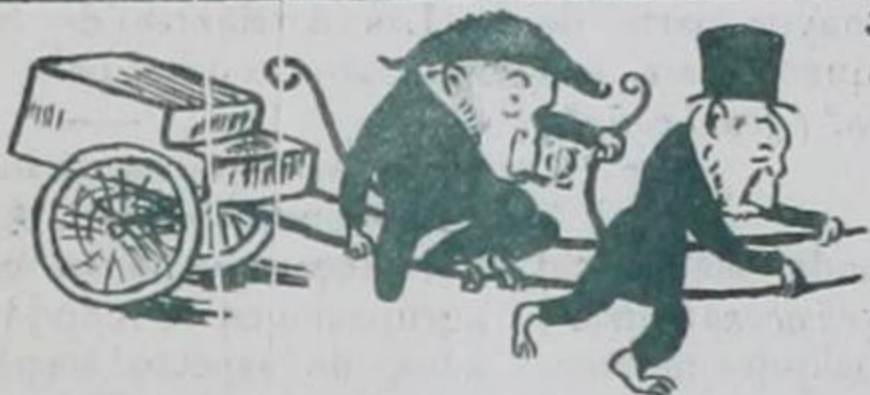
ART. 3º—... El Subsecretario de Relaciones Exteriores irá con los coches que fueren necesarios. En el primero tomará asiento el Ministro Diplomático á la derecha del Subsecretario...