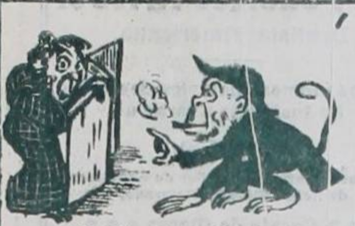
ART. 2º— Si el Ministro Diplomático desea tener una entrevista privada.....