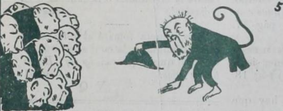
ART. 3º—... El Ministro Diplomático entrará en la sala de audiencia, hará un saludo con una inclinación...