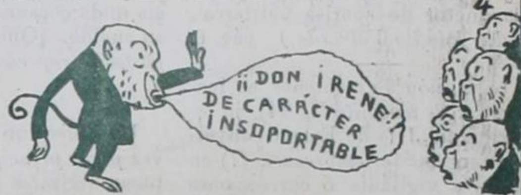
ART. 3º—... El Subsecretario anunciará al señor Ministro por su nombre y carácter.