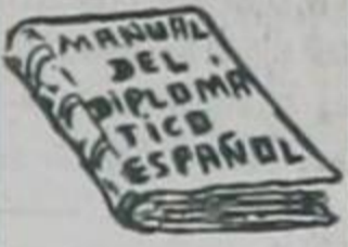
¡OJO! El cuerpo del delito