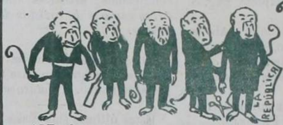
ART. 6º—... Los miembros del Gobierno en el acto de la recepción vestirán de levita. (Excepto uno que llevará chaqueta).